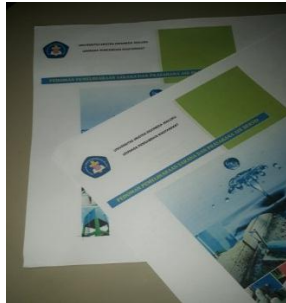
Gambar 5. Buku Pedoman Pemeliharaan Sarana dan Prasarana Air Bersih Kegiatan Sosialisasi

Buku pedoman yang disusun oleh tim PkM UKIM masih dalam bentuk hasil cetak yang belum ber ISBN. Namun target kedepannya harus Ber ISBN dan dapat menjadi bahan referensi bagi masyarakat luas.