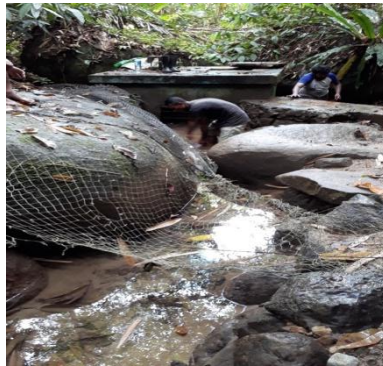
Gambar 2. Kondisi Sumber Mata Air dan Bronkaptering pada aliran air yang tidak terlindungi dan dilengkapi saringan air, sehingga pada musim penghujan airnya keruh

Permasalahan lain yang terjadi adalah pada musim penghujan air yang dikonsumsi setiap hari berwarna keruh dan sampai saat ini belum pernah di uji Ph air tersebut di laboratorium. Persyaratan kualitas air dari segi persyaratan fisik yaitu Secara fisik air bersih harus jernih, tidak berbau dan tidak berasa. Selain itu juga suhu air bersih sebaiknya sama dengan suhu udara atau kurang lebih 25OC, dan apabila terjadi perbedaan maka batas yang diperbolehkan adalah 25\text{oC} \pm 30\text{oC} . Secara kimiawi Air bersih tidak boleh mengandung bahan-bahan kimia dalam jumlah yang melampaui batas. Beberapa persyaratan kimia antara lain adalah: pH yang diperbolehkan berkisar antara 6,5-8,5. (Purnamasari, 2015).