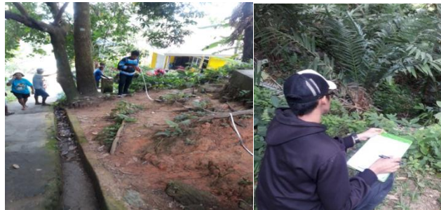
Gambar 3. Kegiatan Survey dan Pengukuran Jaringan 07 September 2019 tgl 01/09/2019

Kegiatan Survey dilakukan dengan cara pengukuran jaringan pipa yang akan direncanakan sesuai kondisi medan, pengambilan data jumlah penduduk dan jumlah rumah yang ada dalam pelayanan RT 005/ RW 001 Kelurahan Batu Gajah.