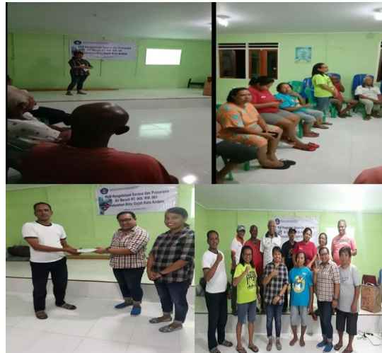
Gambar 6. Rangkaian Kegiatan Sosialisasi (Penyampaian Hasil Desain Jaringan dan RAB, Penyerahan Dokumen Desain, Penetapan Iuran dan Buku pedoman)

PkM, mitra akan segera melakukan penetapan kepada masyarakat RT 005/ RW 001 sebagai masyarakat pemakai air bersih.