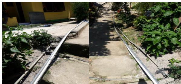
Gambar 1. Kondisi jaringan pipa di areal pemukiman yang tidak tertata secara baik

Dalam upaya penyediaan air bersih, jaringan distribusi merupakan hal yang penting. Karena jaringan distribusi inilah yang menyalurkan air dari instalasi produksi menuju ke masyarakat.( Naway, 2013). Berkenaan dengan meningkatnya kebutuhan air bersih di masa mendatang. Apabila sistem jaringan air bersih telah dioperasikan, maka sebaiknya pengelolaannya diserahkan kepada pihak yang berkompeten dalam pekerjaan ini, dan diperlukan keterlibatan masyarakat dalam pemeliharaan sarana tersebut. (Purnamasari, 2015).