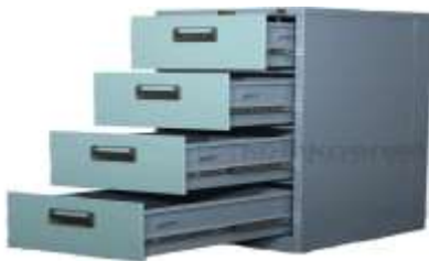
Gambar 3 Filing Cabinet

Filing cabinet merupakan tempat untuk menyimpan arsip yang disusun secara vertikal dengan menggunakan lembar guide dan map gantung.