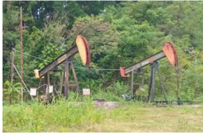
Gambar 2.1 Sucker Rod Pump