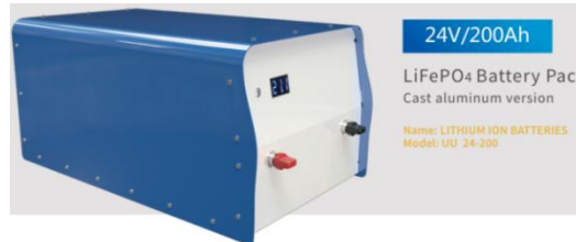
Gambar 2 Baterai LiFePo4 24V 200Ah

siklus pengisian dan pengosongan, menjadikannya pilihan ideal untuk aplikasi penyimpanan energi jangka panjang. Dengan daya tahan yang tinggi, baterai ini mampu bertahan lebih dari 5000 siklus dalam kondisi penggunaan normal dan menunjukkan degradasi minimal selama siklus tersebut. Selain itu, baterai ini efisien, dapat diisi ulang hingga 90% tanpa merusak kapasitasnya, serta memiliki stabilitas kimia yang baik yang mengurangi risiko kebakaran. Baterai LiFePO 4 juga ramah lingkungan karena terbuat dari bahan yang tidak beracun dan dapat didaur ulang.