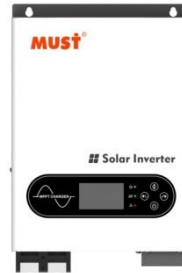
Gambar 3 PV1800 ECO Series

menghasilkan daya 5.160W, yang dimana setiap string akan dipasang 1 inverter dan battery bank yang akan dihubungkan ke inverter memiliki total tegangan masing-masing sebesar 48V untuk 16 inverter dan masing-masing 48V untuk 4 inverter. Maka inverter yang digunakan adalah inverter dengan besar daya 5.160W, sehingga inverter yang digunakan dalam penelitian ini adalah PV1800 ECO Series 6.200W sebanyak 20 buah.