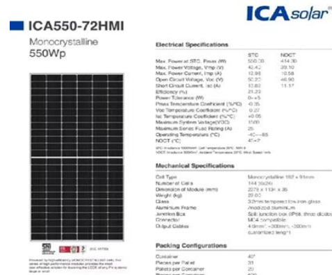
Gambar 1. Panel Surya Monocrystalline 550Wp

Panel surya monocrystalline 550Wp memiliki spesifikasi sebagai berikut: