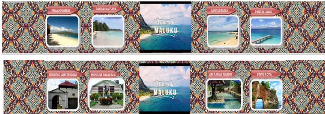
Gambar 4. Tampak samping Kemasan