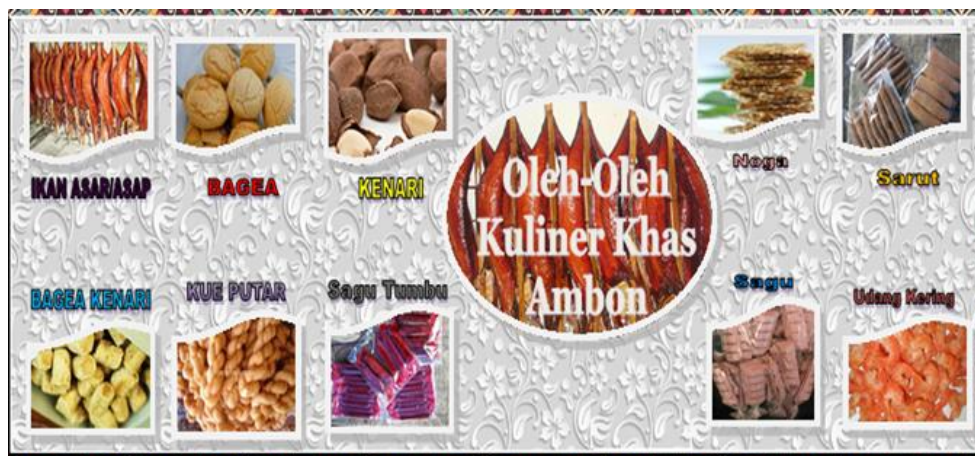
Gambar 3. Tampak atas Kemasan

Dengan menggunakan aplikasi ini memudahkan penulis untuk mendesign latar belakang, tampak depan, samping kemasan dengan mudah, meindahkan dan merubah sesuai keinginan penulis. Agar supaya kemasan ini lebih bermanfaat lagi masyarakat, ditambahkan materi-materi lain terkait dengan oleh-oleh khas Kota Ambon. Gambar design kemasan yang telah dibuat dapat dilihat dibawah ini.