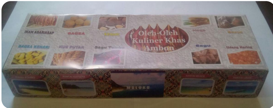
Gambar 5. Tampak secara 3D