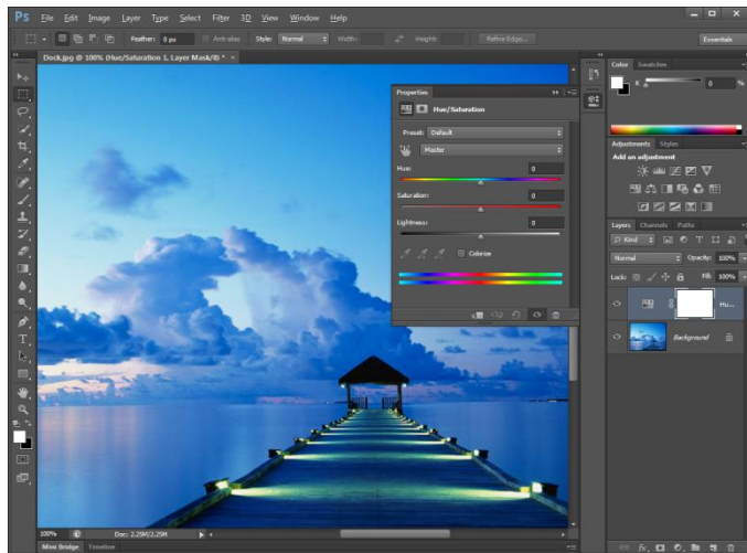
Gambar 1. Tampilan Adobe Photoshop CS6

Kemasan dibuat menjadi beberapa jenis bergantung pada bentuk dan ukuran serta berat ikan. Wadah tempat produk didesain sedemikian rupa sehingga aman bagi produk, menarik, serta nyaman bagi konsumen untuk dibawa kemana-mana. Kemasan dirancang dan didesain menggunakan program khusus untuk design.