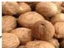
Gambar 8. Biji pala tanpa tempurung asal Srilanka